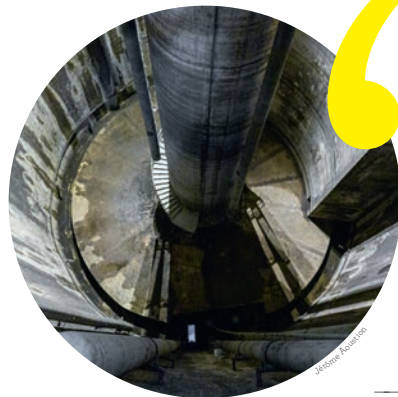
Bassin de stockage, place des Fêtes à Bezons.