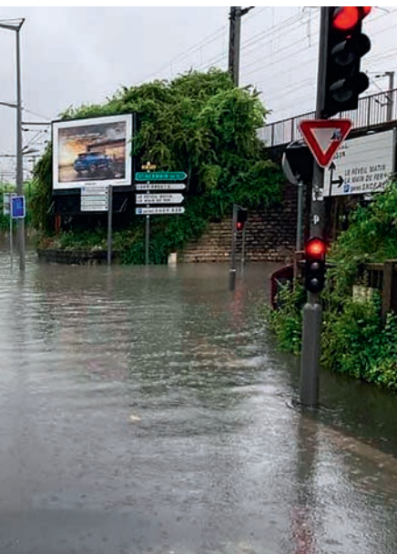
Rue de la Convention (RD311), au niveau du pont SNCF.

À l'issue de cette étude, de nouvelles contraintes urbanistiques devraient être adoptées. Parallèlement, le service voirie travaille actuellement à la mise en œuvre de nouvelles techniques de revêtement des sols, capables d'absorber une partie des eaux de ruissellement.