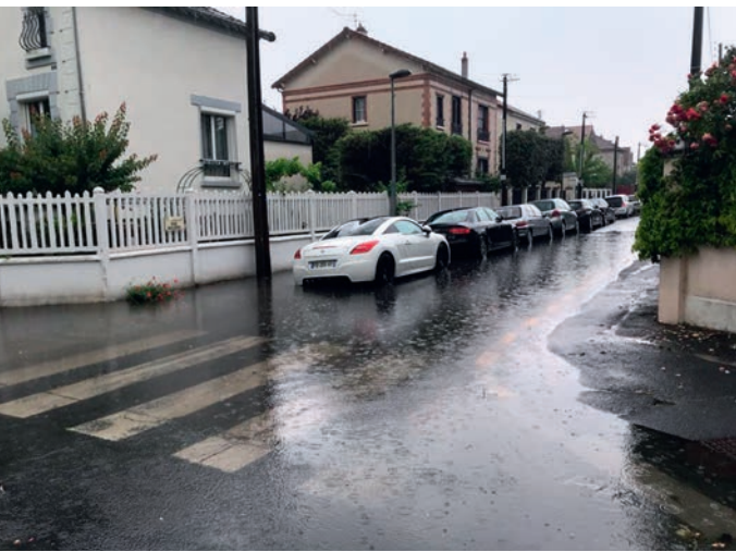
Inondations, rue Molière.

À Houilles, les intempéries du 22 juin dernier ont provoqué des inondations d'envergure dans plusieurs secteurs de la ville. Après avoir obtenu la reconnaissance de la commune en état de catastrophe naturelle, la municipalité se mobilise afin de se prémunir et de lutter au mieux contre ce type d'événement. Les causes des inondations subies par un grand nombre d'habitations et de commerces ovilleois lors de cet épisode climatique exceptionnel sont d'origine multifactorielle. Elles sont liées à un volume de précipitations important dans un laps de temps très court, mais également au ruissellement des eaux et à la nature des sols.