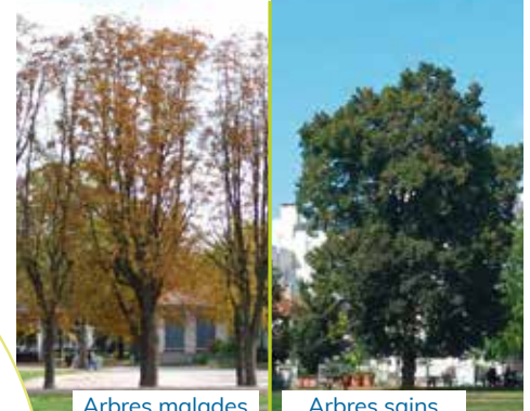
Arbres malades (août 2024).