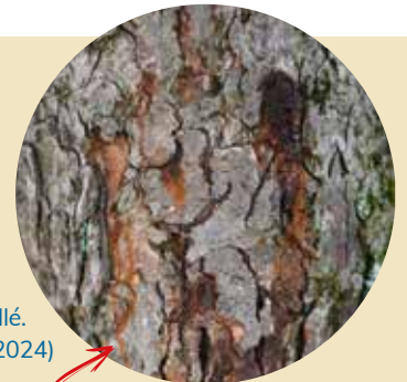
Maladie du bois mouillé. (photo août 2024)

Mineuse du marronnier (photo août 2024).