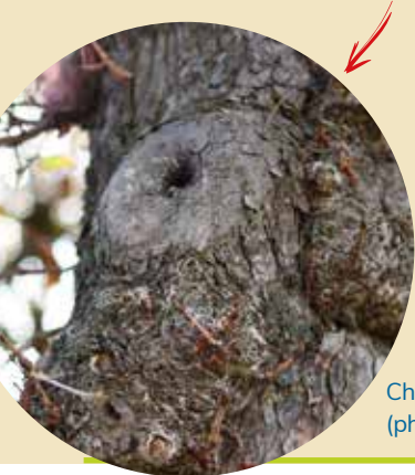
Chancre bactérien (photo août 2024).

⚠ Chaque année en France, les arbres malades causent des accidents.